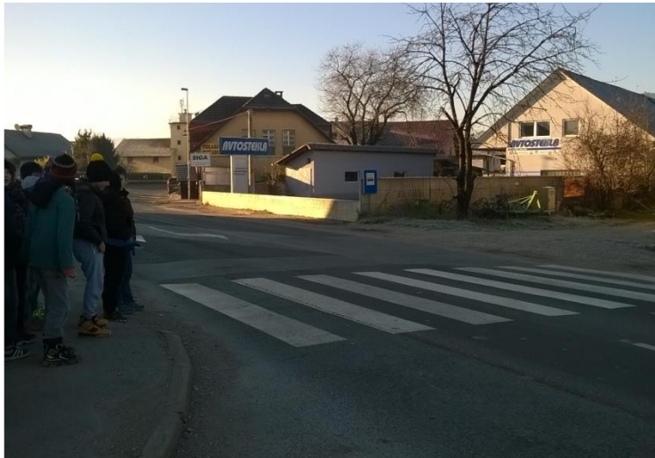
Prehod za pešce Kranj-Šk. Loka

Iz Zgornjih, Srednjih in Spodnjih Bitenj se učenci od 2. do 5. razreda v šolo Žabnica pripeljejo in odpeljejo z avtobusom. Šolski avtobus jim ustavlja na vaških dogovorjenih »postajališčih«. Predvidoma prične ob 7.15 z vožnjo iz Zgornjih Bitenj, sledijo Srednje Bitnje in Spodnje Bitnje, kjer tudi zapelje na glavno cesto in učencem ustavi na parkirišču pred šolo. Učenci gredo varno do šole in jim ni potrebno prečkati nobenih nevarnih prehodov in poti.